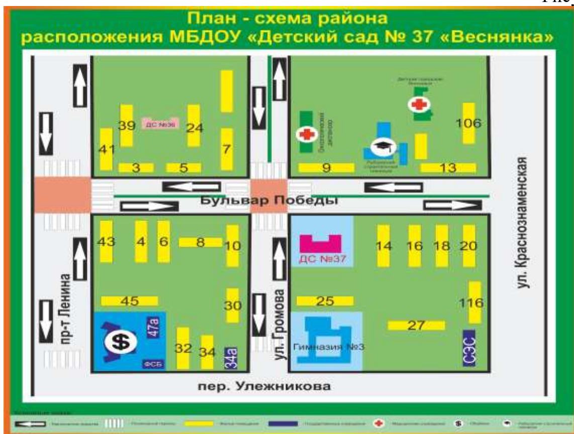
План-схема района расположения МБДОУ «Детский сад № 37 «Веснянка»

Территория детского сада озеленена насаждениями. На территории учреждения имеются различные виды деревьев (орех, дуб, ель, сосна, рябина, липа), газоны, украшенные цветочными клумбами.